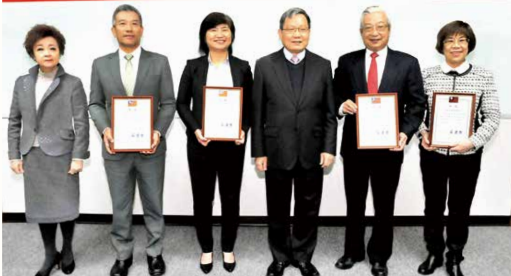
財政部蘇部長建榮於110年3月份「公股金融事業業務研討會」頒獎表揚109年度輸出保險業務績優合作銀行，以表彰政府對輸出保險政策性功能之重視。(110年3月攝)