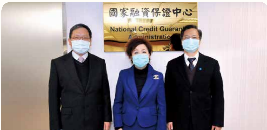
110 年 1 月 20 日「國家融資保證中心」於本行正式成立，並由財政部蘇部長建榮（左）、國發會龔主任委員明鑫（右）與本行劉理事主席佩真共同舉行揭牌典禮。（110 年 1 月攝）

本行最近年度及截至年報刊印日止，無辦理銀行併購、轉投資關係企業、重整之情形；且無隸屬特定金融控股公司，亦無股權之大量移轉或更換、經營權之改變、經營方式或業務內容之重大改變及其他足以影響股東權益之重要事項。