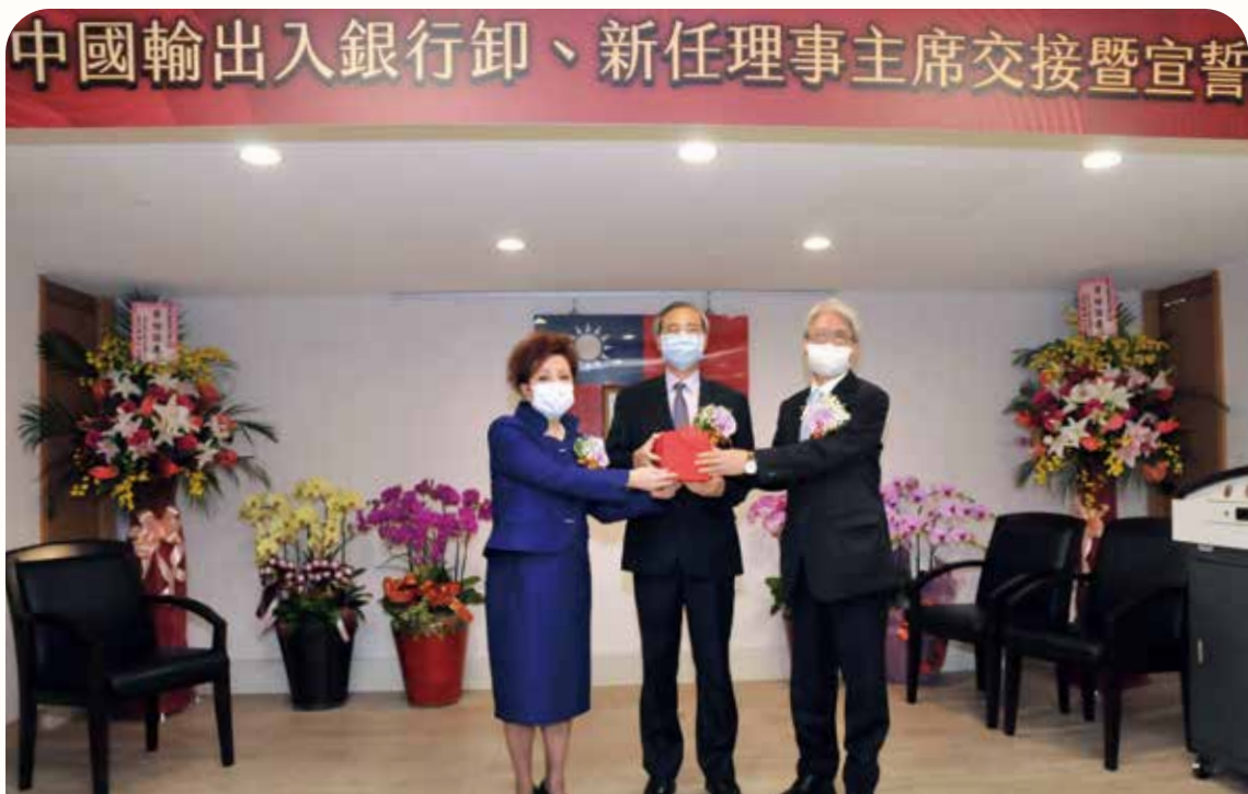
本行於 109 年 11 月份舉行卸、新任理事主席交接暨宣誓典禮，並由財政部阮政務次長清華主持監交儀式。(109 年 11 月攝)

本行為百分之百公股銀行，員工薪資依據「財政部所屬金融保險事業機構用人費薪給管理要點」規定辦理，爰未設置薪資報酬委員會。