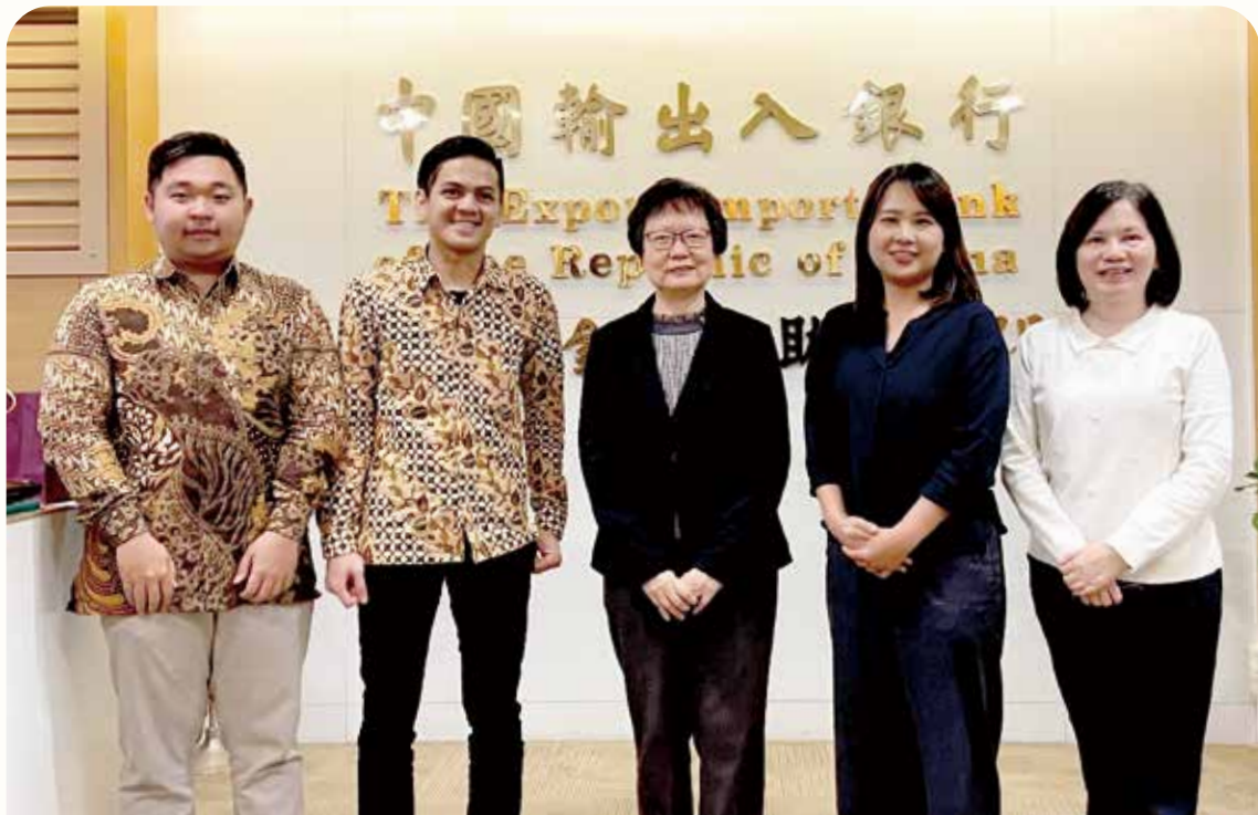
本行與印尼國家銀行 PT Bank Negara Indonesia (Persero) Tbk 簽訂轉融資合約，雙方期盼透過轉融資嘉惠臺灣與印尼之廠商，以協助我國廠商拓銷印尼市場。(110 年 3 月攝)

配合政府經貿政策辦理轉融資業務，透過授予全球各地信譽良好之金融機構優惠美元貸款額度，以供轉貸予國外廠商購買我國產品，國外買主因此可享有分期付款融資，從而提高其購買我國產品意願，並加強我國產品在國際市場上之競爭力。本行致力於全球各國布建轉融資據點已有多多年，截至 109 年底止，本行已於巴西、智利、多明尼加、厄瓜多、薩爾瓦多、瓜地馬拉、宏都拉斯、尼加拉瓜、巴拿馬、巴拉圭、亞美尼亞、白俄羅斯、保加利亞、捷克、俄羅斯、土耳其、奈及利亞、南非、馬紹爾群島、柬埔寨、印度、印尼、蒙古、菲律賓、泰國、烏茲別克、越南等 27 個新興市場國家及美國建立轉融資據點，合作銀行涵蓋美洲、歐洲、大洋洲、非洲及亞洲等地區共計 78 家金融機構，合計授予轉融資額度 8.84 億美元。