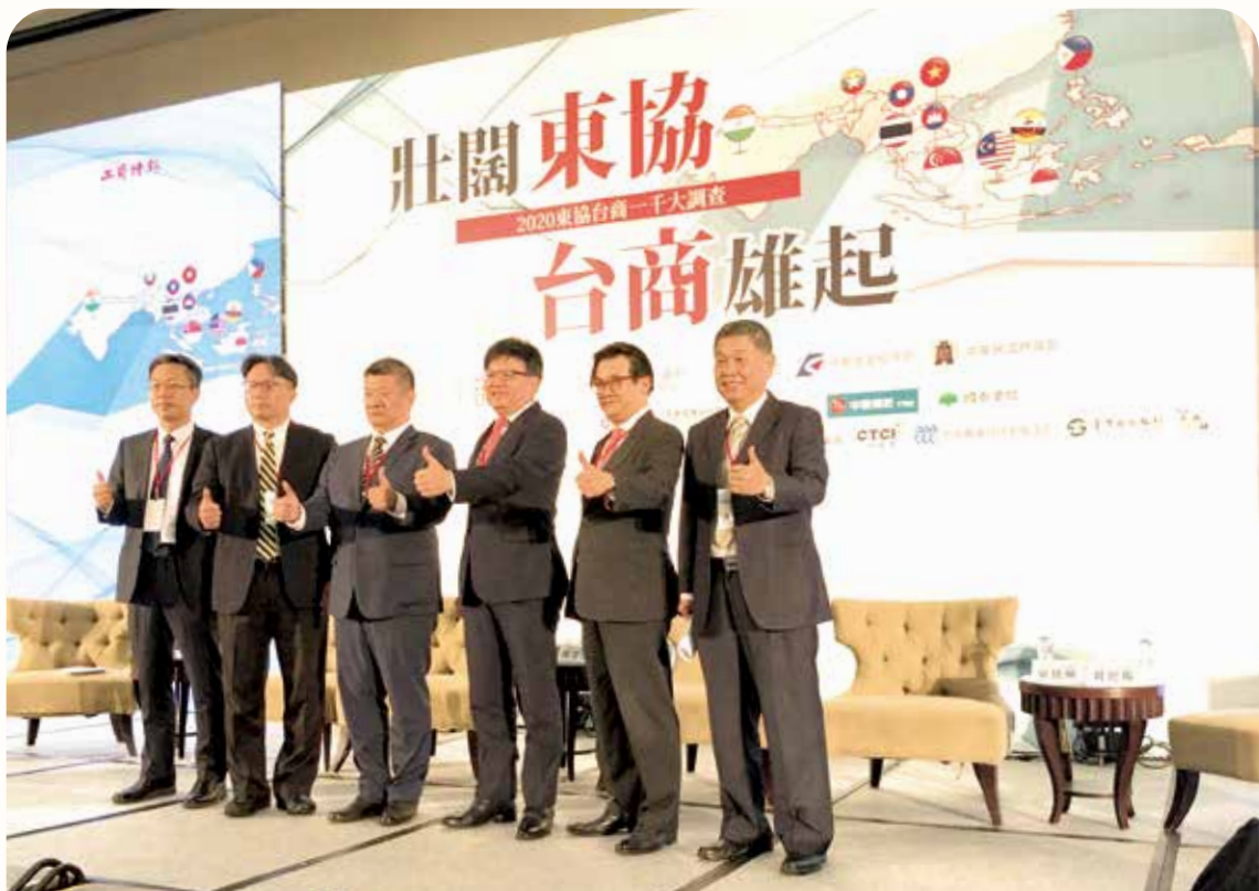
本行參加「壯闊東協 台商雄起」論壇，並與各家投信、銀行及金控代表就東南亞經濟、文化、產業發展及臺灣金融業在當地的發展現況，進行深度交流並交換意見。（109 年 8 月攝）

109 年度轉銷呆帳無列數，另追回以前年度已轉銷之呆帳新臺幣 6,843 萬 7 千元。