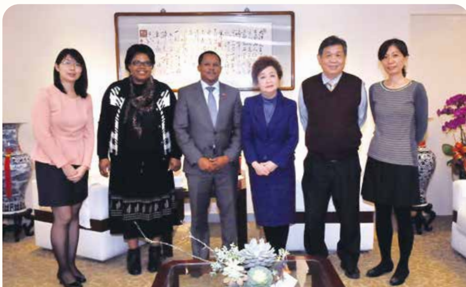
我國友邦史瓦帝尼大使率團來行訪問，以促進雙方經貿合作與交流。(109 年 12 月攝)