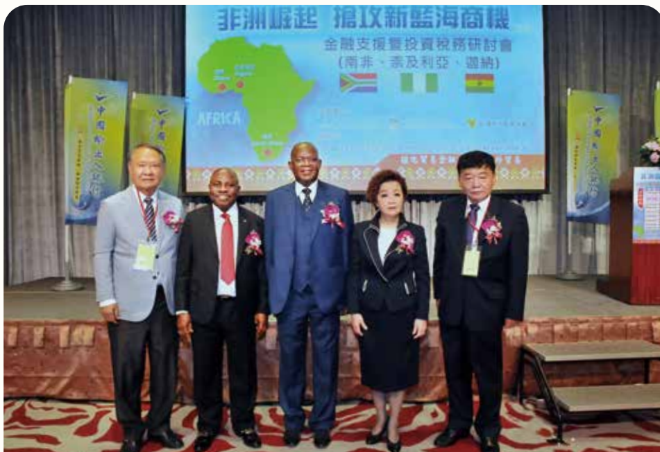
本行與南非聯絡辦事處及台灣非洲經貿協會共同舉辦『非洲崛起 搶攻新藍海商機』金融支援暨投資稅務研討會，除讓企業了解拓展非洲業務，本行亦提供廠商規避風險及取得資金之管道，以利其拓銷海外市場。(110 年 4 月攝)