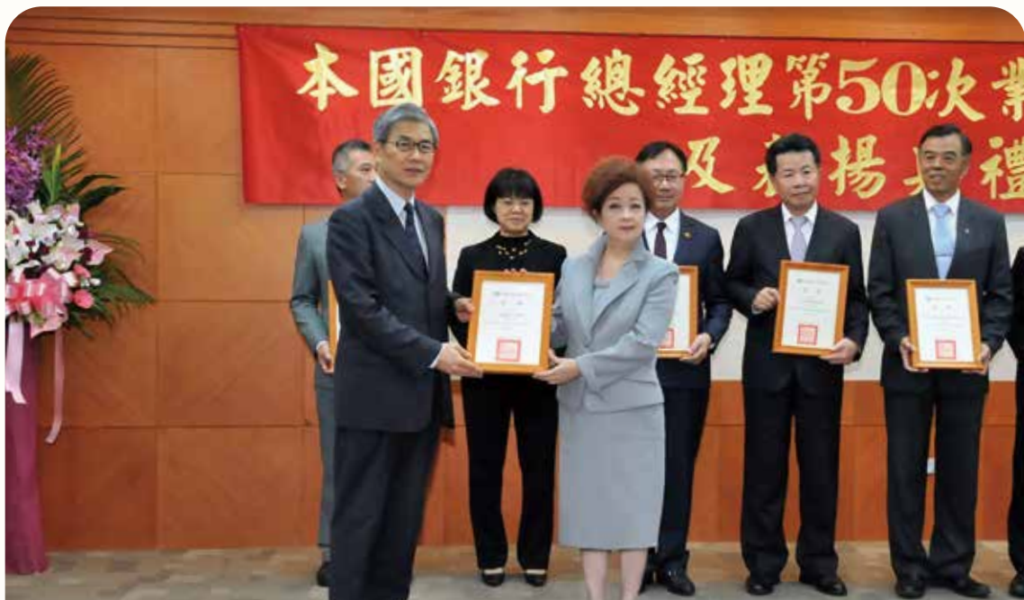
金管會為表揚本行對校園金融知識宣導之貢獻，頒發「走入校園與社區辦理金融知識宣導活動」特別獎，以表彰本行對我國金融人才培育的用心及努力。(109年6月攝)