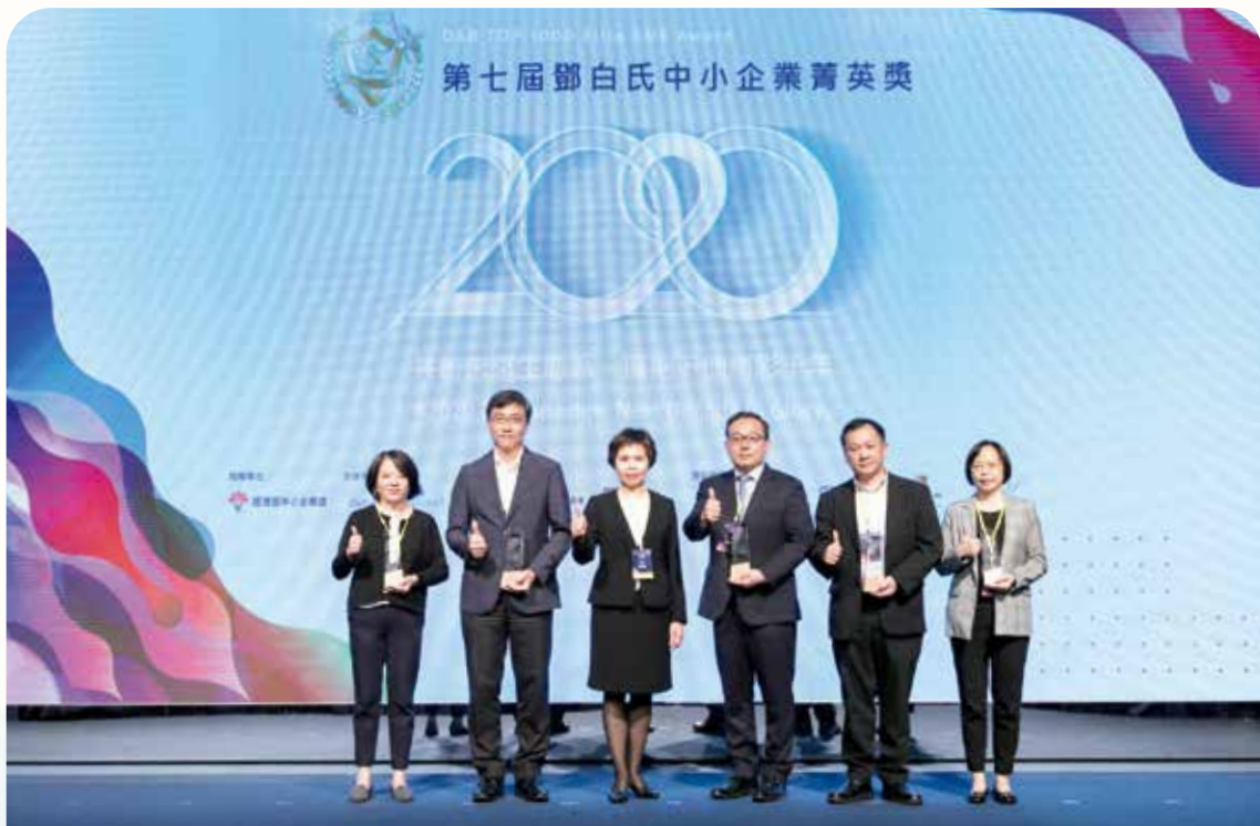
本行攜手鄧白氏徵信所共同舉辦第七屆中小企業菁英獎，並於會中表揚對新南向政策出口貿易有卓越貢獻的中小企業。(109年10月攝)