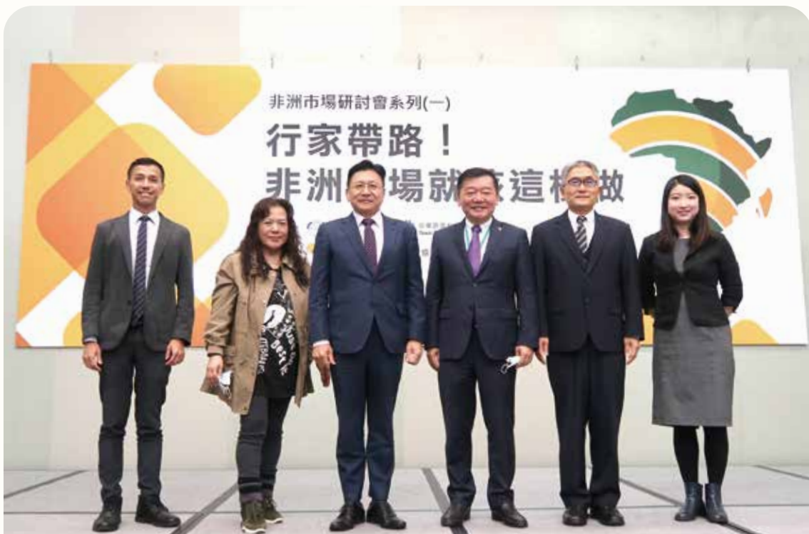
本行參加由外貿協會與經濟部國際貿易局共同舉辦之「行家帶路！非洲市場就該這樣做」非洲市場研討會，並於會中宣傳如何利用政府金融資源，取得資金並利用輸出保險規避貿易風險。（110 年 3 月攝）

本行每年均依業務實際需要訂定年度研究發展計畫。研究項目包括與本行業務相關之新種金融產品開發，國外同業業務發展及國內外經濟、金融、外貿情勢分析及新興市場國情資訊之研析等。