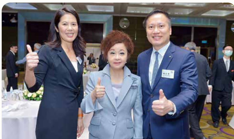
為協助企業因應新冠肺炎衝擊，本行積極推動紓困振興方案，並適時於各大會議場合，如安永聯合會計師事務所舉辦之「後疫情時代越南經濟局勢暨台商因應之道」餐會，宣傳說明優惠申辦內容，以力挺企業度過經營難關。(109 年 6 月攝)