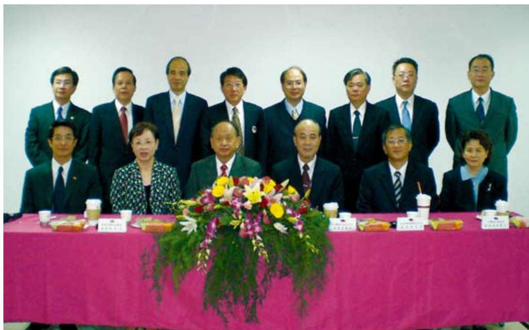
■ 本行參加彰濱秀傳紀念醫院聯貸案。

(四) 依「財政部財經重大事件每日通報機制事項」規定，建立本行各單位聯絡窗口，充分掌握每日重大財經事件，俾迅速通報，有效處理。