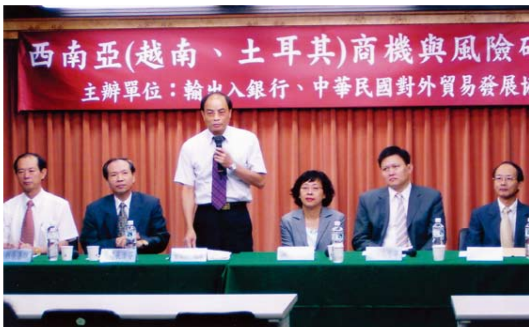
■ 本行舉辦「西南亞（越南、土耳其）商機與風險」研討會。