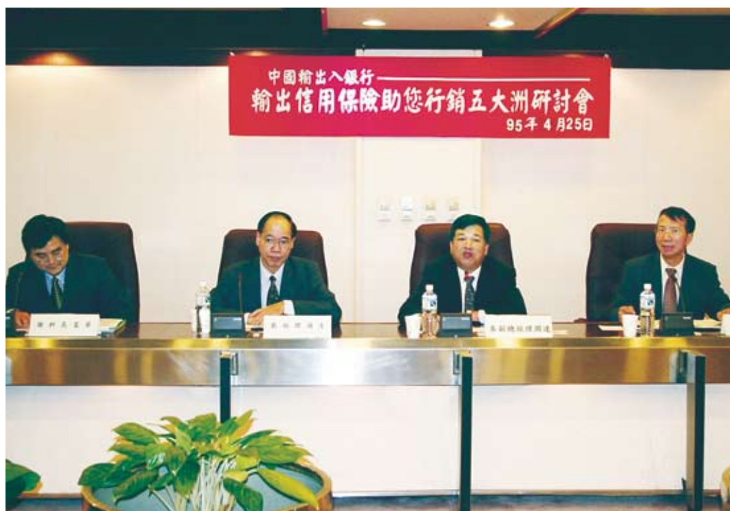
■ 本行舉辦「輸出信用保險助您行銷五大洲」研討會。