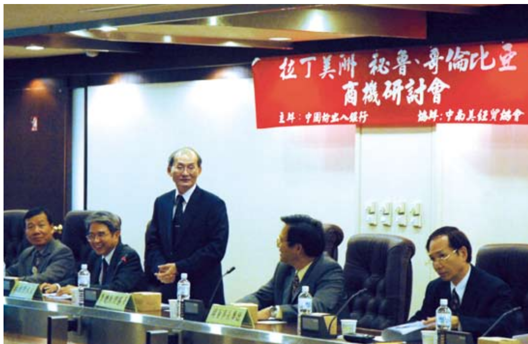
■ 本行舉辦「拉丁美洲（秘魯、哥倫比亞）商機」研討會。

本行最近年度及截至年報刊印日止，無辦理銀行併購、轉投資關係企業、重整之情形；且無隸屬特定金融控股公司，亦無股權之大量移轉或更換、經營權之改變、經營方式或業務內容之重大改變及其他足以影響股東權益之重要事項。