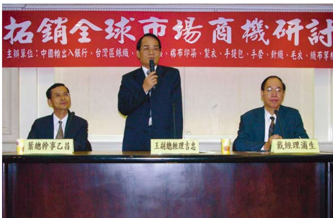
■ 本行舉辦「拓銷全球市場商機」研討會。

內廠商拓展外銷，本行於全球各地佈建轉融資銀行據點，為便利國外轉融資銀行從事本項業務，本行針對不同地區法律條件及市場特質差異，在不影響本行權益下，對合約採彈性作法，以確實發揮本行協助廠商出口之目的，未來將持續密切注意市場需求，積極佈建全球合作銀行網路，並提升服務效率，加強廠商利用意願。另為拓展中、南美洲市場出口貿易，將以個案處理方式依據實質交易以轉融資方式轉貸指定之國外廠商，以達到協助我國廠商出口之實質功能。