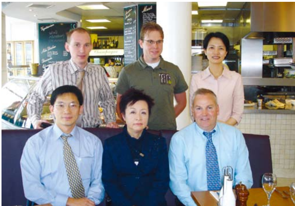
■ 本行派員赴英國Cardiff與合作之保險公司Atradius進行訪問交流。