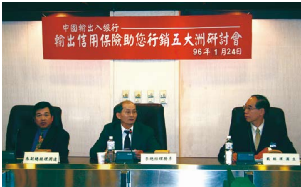
本行舉辦「輸出信用保險助您行銷五大洲」研討會。