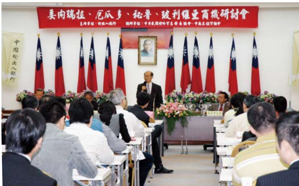
本行舉辦「委內瑞拉、厄瓜多、秘魯、玻利維亞商機」研討會。